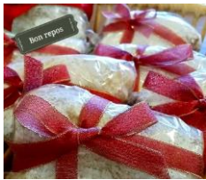
ミニシュトーレン ¥500