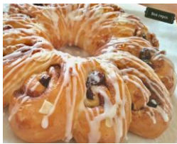
シナモンロール 1カット ¥100